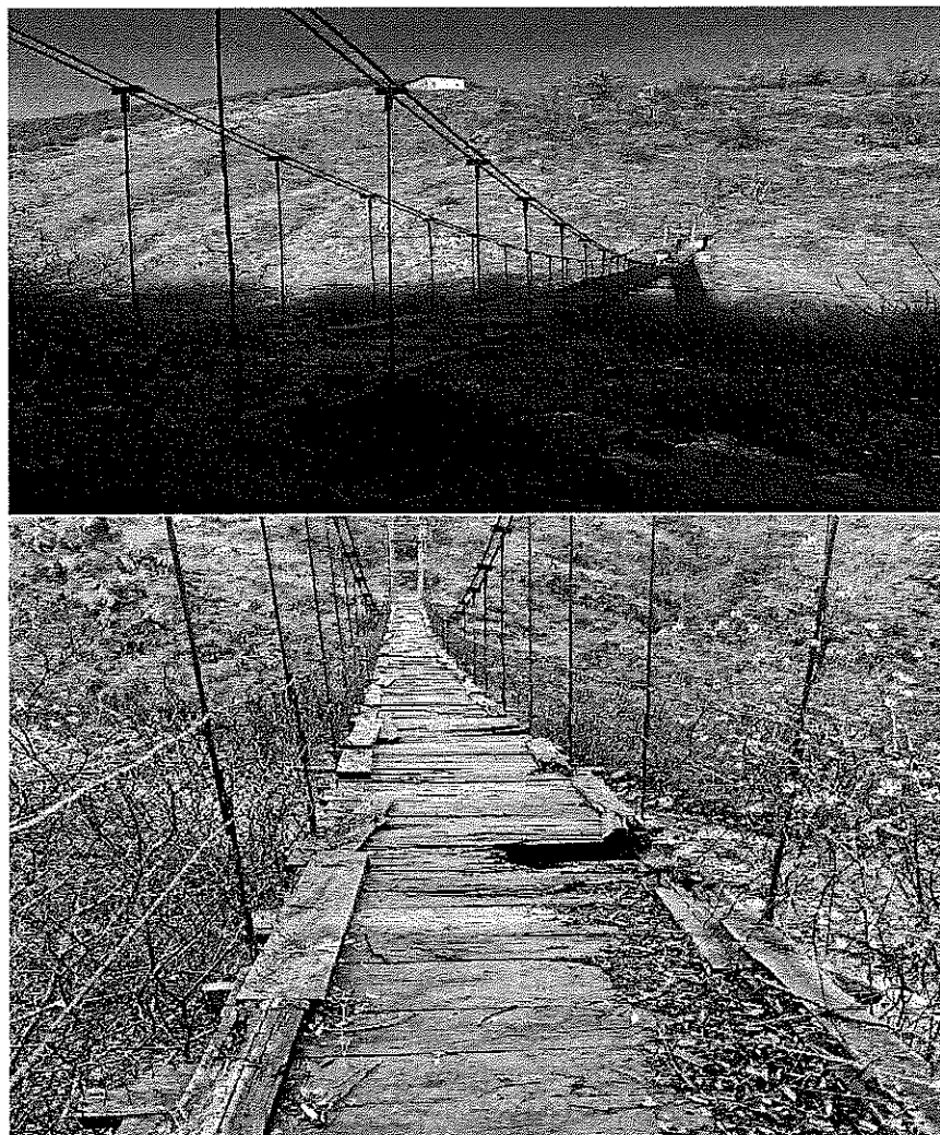
Foto te gjendjes ekzistuese