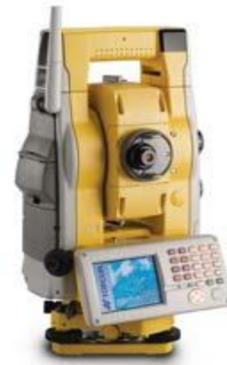
TOPCON GPT 900 A