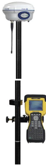
TRIMBELL R6 (gps)