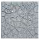
Pllaka 40x40x2.5cm ngjyre gri.