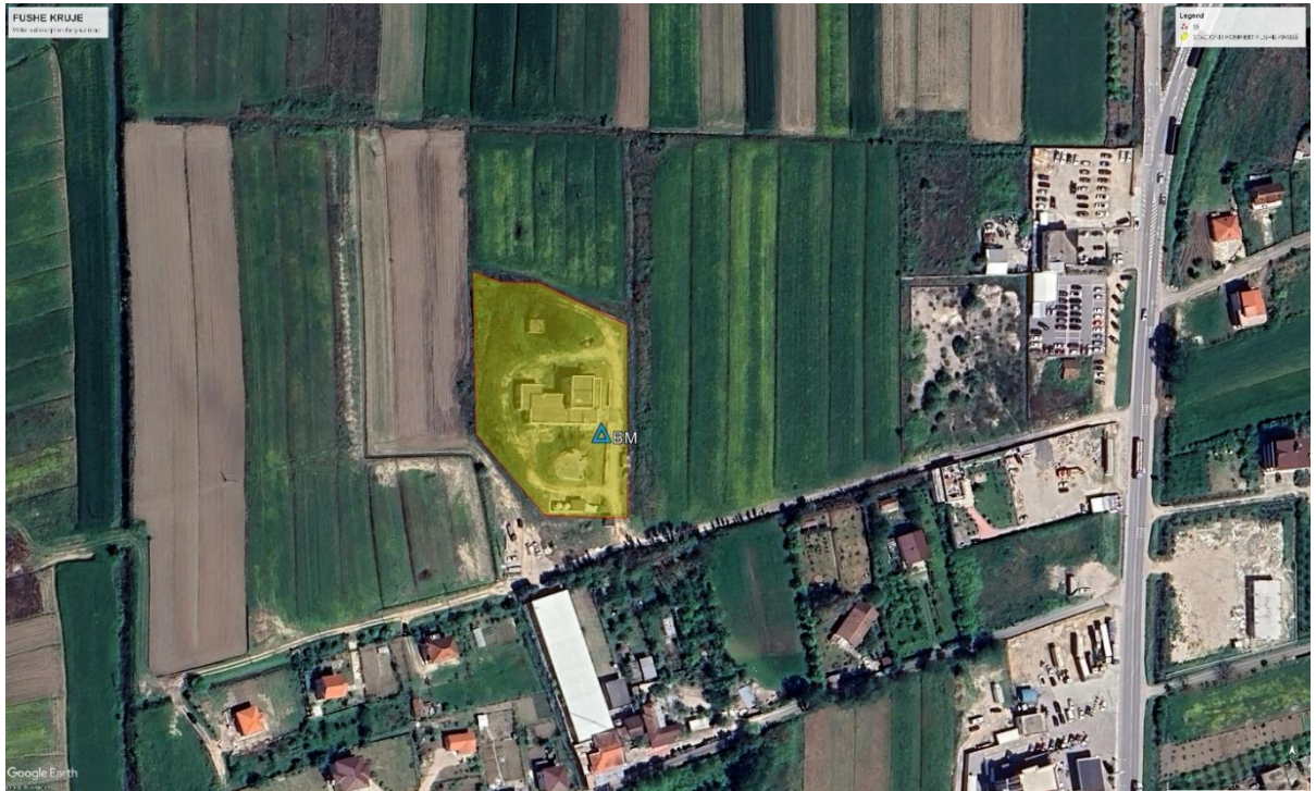
Figura 3: Pamje grafike e zones ku jane vendosur pikat e bazamentit ne Fushë Krujë