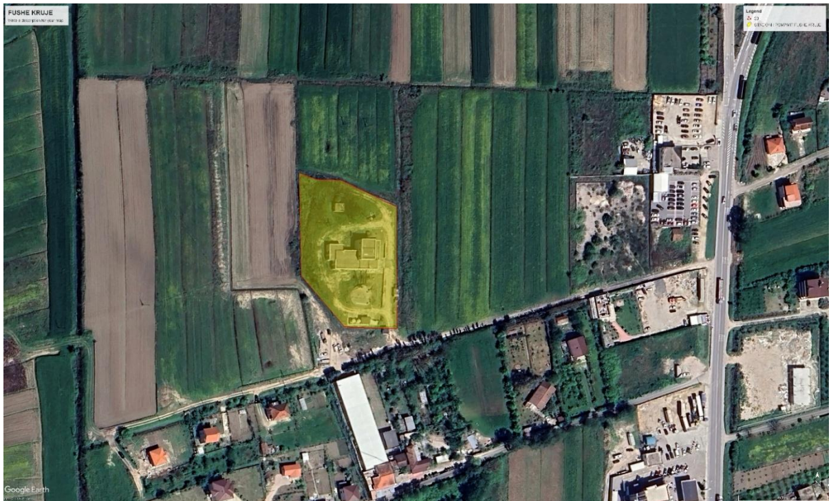
Figura 1: Zona e Stacionit I Fushë Krujës