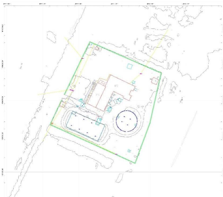
Figura 7: Pamje e zones se rilevuar me teknologjine LiDAR, Stp Çermë e sipërme

Teknologjia LiDAR është një nga metodat më të shpejta dhe më efektive për rilevimet topografike dhe fotogrametrike me sipërfaqe të mëdha, duke mbuluar për një kohë të shkurtër sipërfaqe të gjera dhe njëkohësisht duke ruajtur saktësinë në elementet e terrenit të cilat janë verifikuar me “CHECKPOINT”