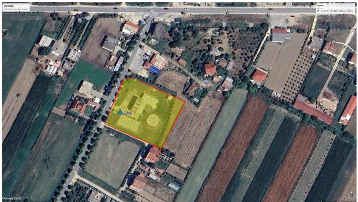
Figura 4: Pamje grafike e zones ku jane vendosur pikat e bazamentit në Çermë e sipërme