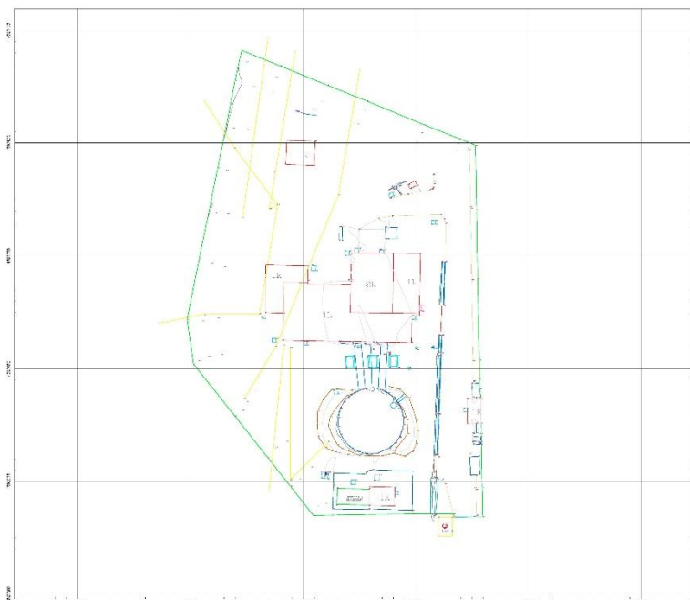
Figura 6: Pamje e zones se rilevuar me teknologjine LiDAR, Stp Fushë Krujë