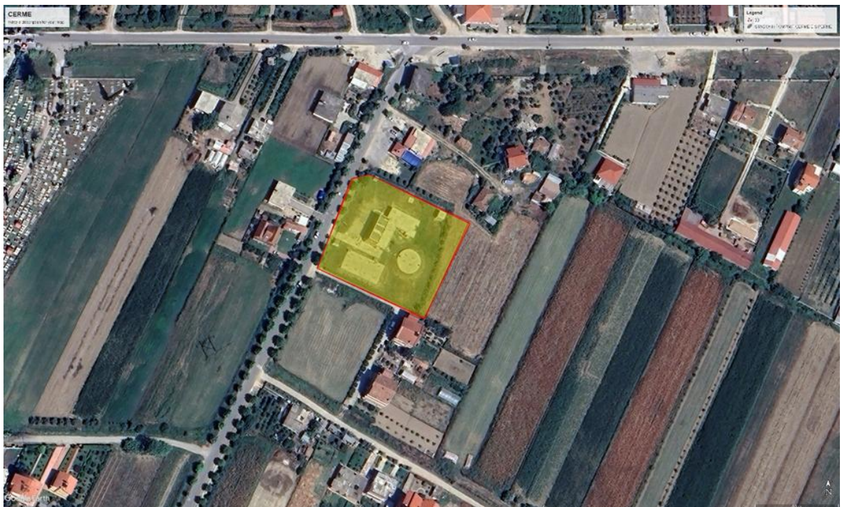
Figura 2: Zona e Stacionit e Çermës së sipërme