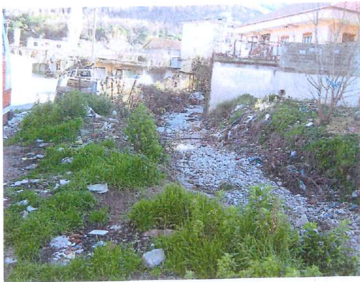
Pamje e perroit ne zonen e qytetit

Sistemimi i perroit te Laçit i sherben komunitetit te ketij qyteti me rreth 12500 banore . Hartimi i projektit eshte bere nga grup inxhinjerash dhe eshte mbeshtetur ne kerkesen e bere nga Bashkia Kurbin , nga lindja e problemeve kur perroi del nga shtrati i tij gjate reshjeve maksimale dhe i demeve qe sjell.