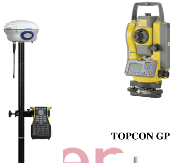
TOPCON GPT 900 A