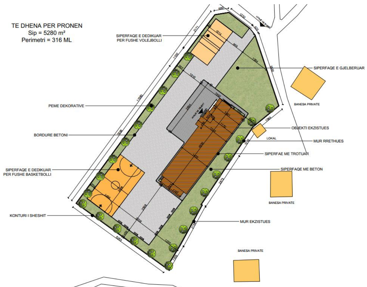
Fig.3. Plani i sistemimit i propozuar