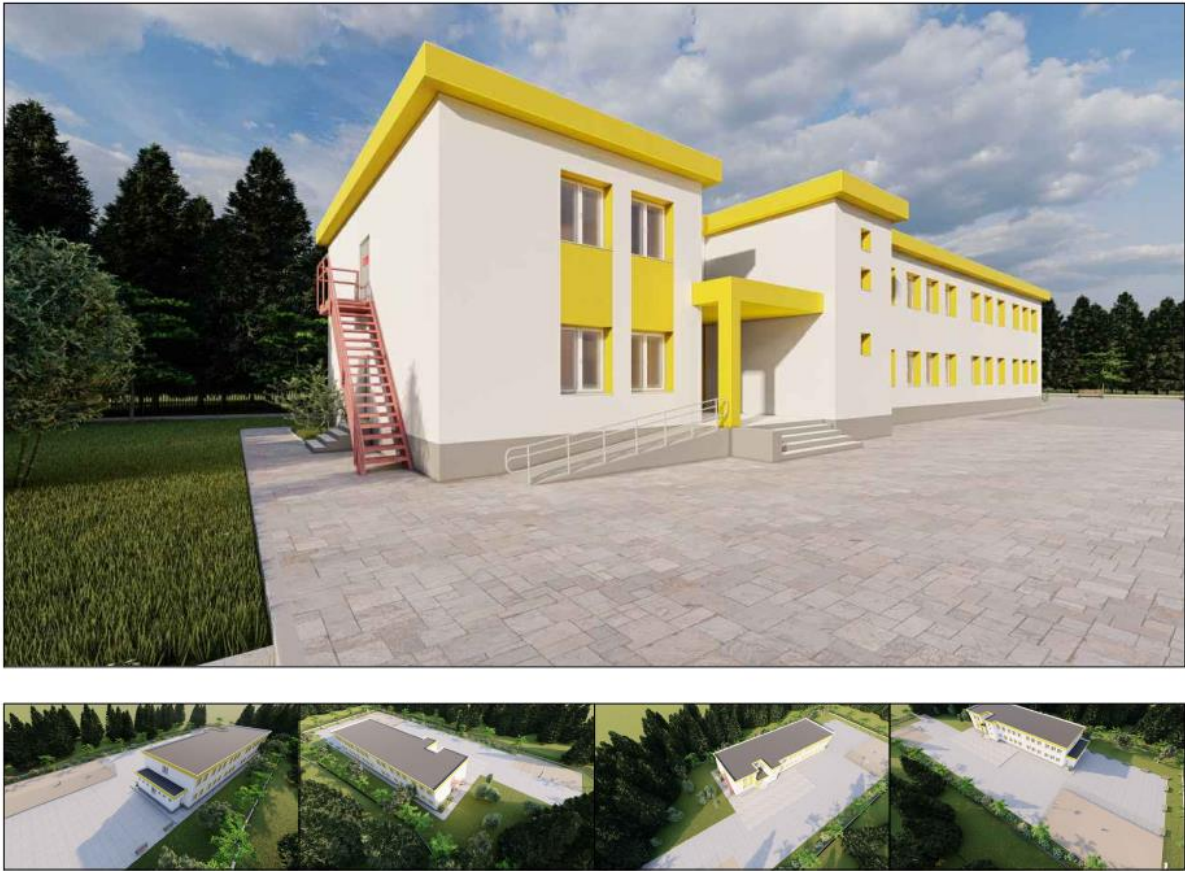
Fig.4. Pamje te objektit

Ne pjesen e jashtme eshte relizuar suvatimi i objektit, hidroizolimi dhe sistemimi i hapësirave te jashtme