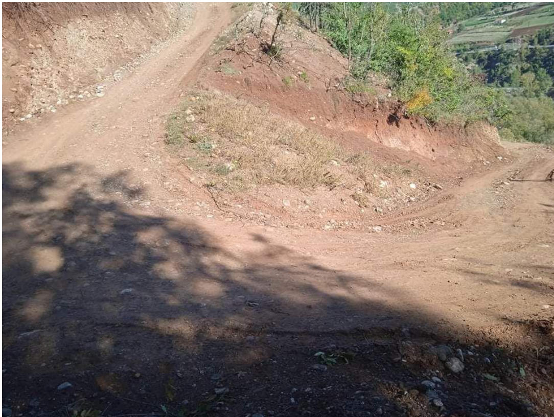
Fig.1.1 Rruga e lagjes Semës për te varrezat, Nj.Adm Qendër