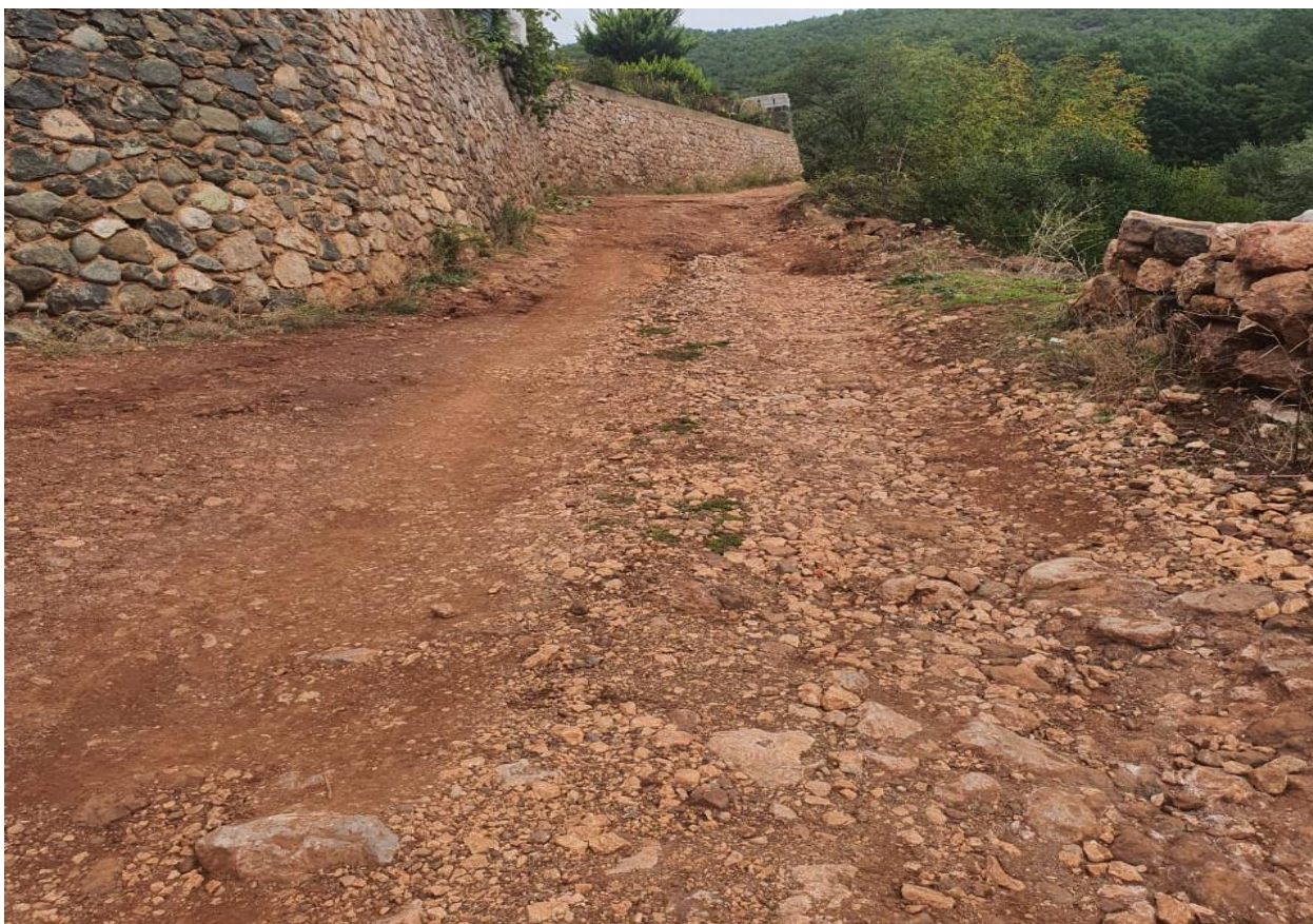
Rruga e lagjes Peshtan, fshati Vehcan