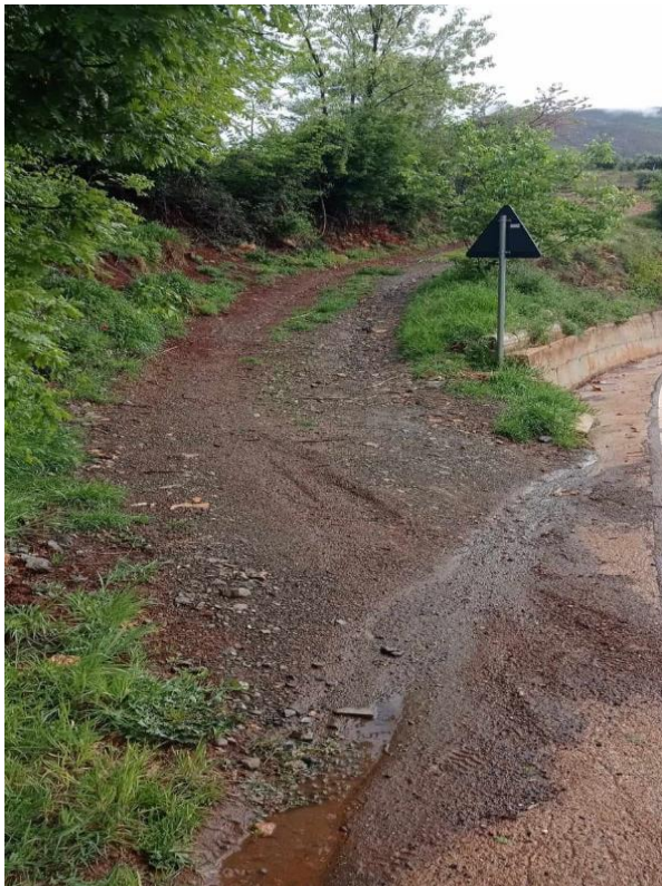
Foto nga gjendja ekzistuese te segmenteve të lartpërmendura

Ne keto segmente do te nderhyhet ne gjatesite e siperpermendura me gjeresi 3m. Qellimi I saj eshte per te zbutur pjerresine e ketyre rrugeve dhe rritur sigurine e levizjes ne to.