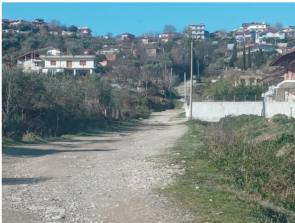
Foto te gjendjes ekzistues