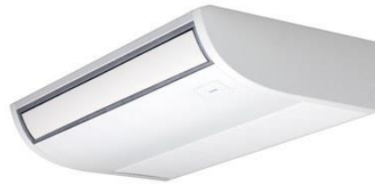
NJESIA 'CEILING' VRF