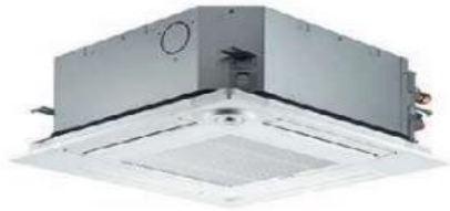
NJESIA KASETE ME 4-DREJTIME VRF