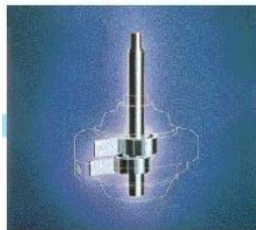
DC Twin Rotary Compressor