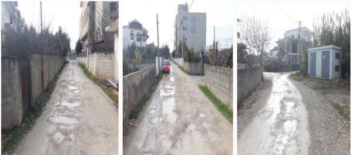
Foto të gjendjes ekzistuese.

Rruga e cila do të rikonstruktohet, paraqitet në gjendje të degraduar.