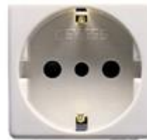
Fig. 2 Kontaktet e tokës

Gjithë prizat, derisa të bëhet një tjetër specifikim, duhet të jenë të tipit 16 amper 2-pin dhe të dala në sipërfaqe. Ato duhet të kenë montim rafsh duhet të kenë një ngjyrë që të shkojë më paftat e çelësave të ndriçimit.