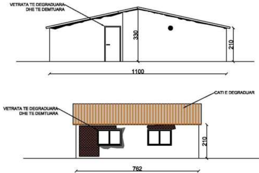
FOTO TE GJENDES EKZISTUESE

Sipas konstatimeve ne vend nga inxhinieri perkates mund te shihet nevoja e perforcimeve me beton arme apo strukurave metalike sipas rastit. Keto perforcime mund te jene ne themele apo ne strukturen mbajtese mbi toke te baneses. Ka raste ku tavani eshte i gjithi i harkuar dhe per kete arsye lind nevoja e shtimit te elementeve perforcues beton arme