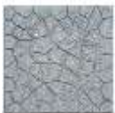
Pllaka 40x40x2.5cm ngjyre gri.