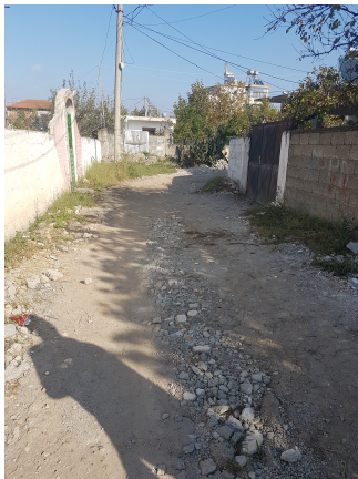
FOTO TE RRUGES

Keto rruge, qe do ti nenshtrohet rikonstruksionit jane te pashtuar.Mungon sistemi i kullimit te ujrave te bardha dhe ujrave te zeza.